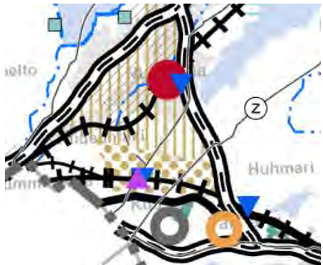
Kuva 3 Ote Helsinginseudun maakuntakaavasta Nummelan kohdalta. © Uudenmaanliitto

Uusimaa-kaavan 2050 aineistoon voi tutustua tarkemmin Uudenmaanliiton sivuilla: https://uudenmaanliitto.fi/kaavoitus-ja-liikenne/maakuntakaavat/uusimaa-kaava-2050/