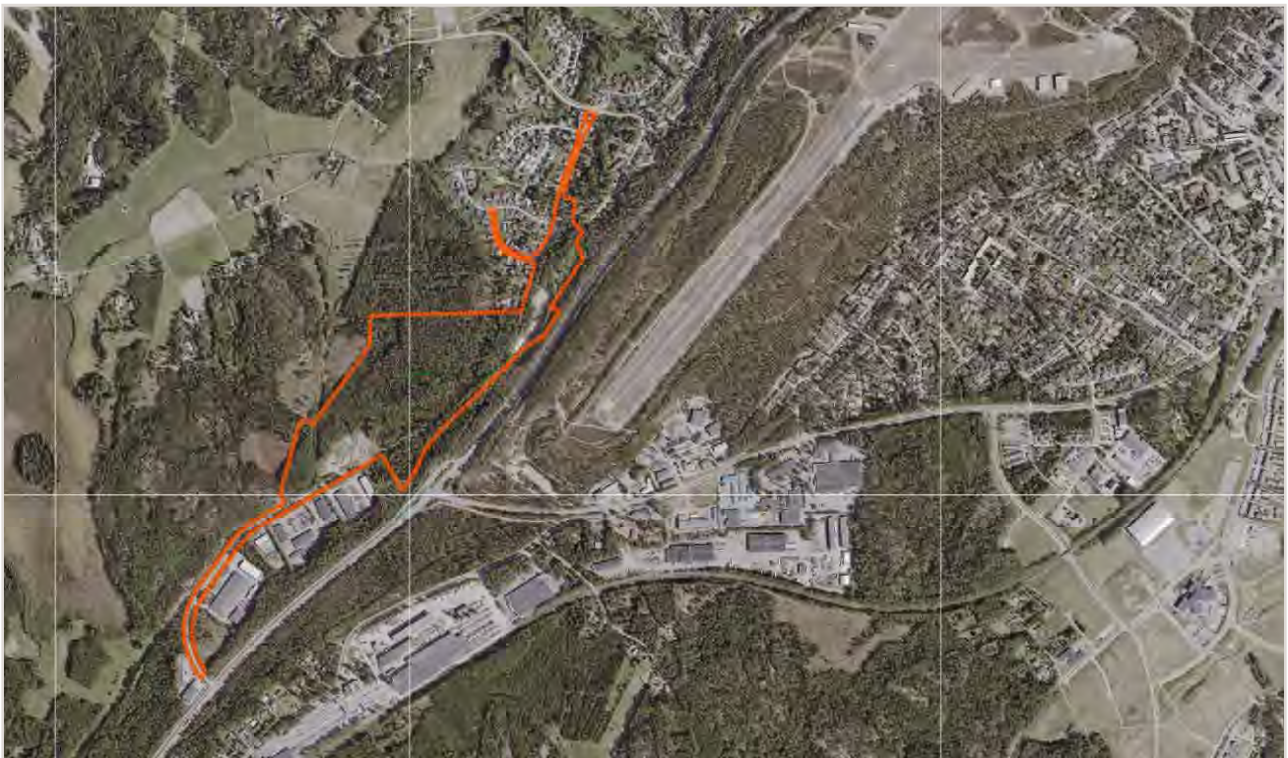
Kuva 2 Kaava-alue rajattuna ilmakuvalla.

Kaavan N163b tavoitteet voivat tarkentua kaavan laadintaprosessin aikana. Katusuunnittelua tehdään samanaikaisesti asemakaavan kanssa ja kaava perustuu katusuunnitelman ratkaisuihin.