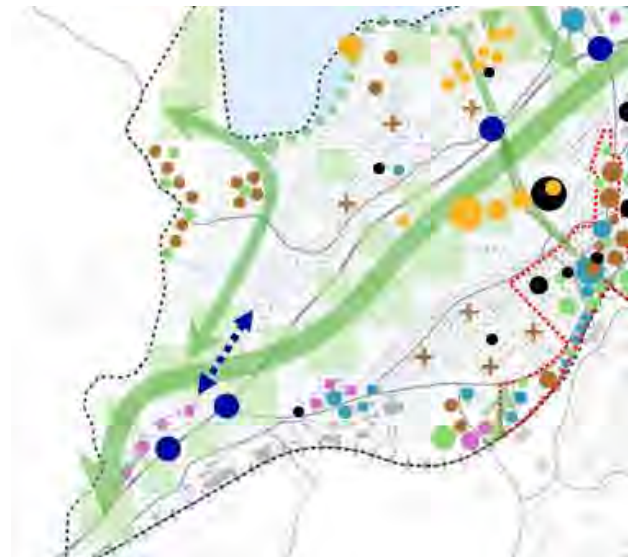
Kuva 4 Ote Nummelan osayleiskaavan luonnoksesta VE1.