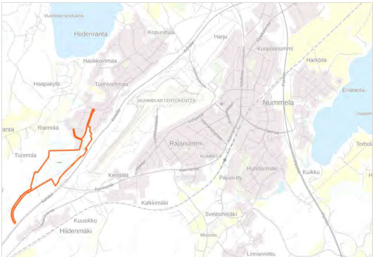
Kuva 1 Kaava-alueen sijainti taustakartalla ©MML

Kaava N163 on ollut vireillä jo 14.10.2014 alkaen. Kaavan ensimmäinen osa, N163a, on saanut lainvoiman 15.4.2026. Kaavan N163b osalta on laadittu tämä päivitetty osallistumis- ja arviointisuunnitelma.