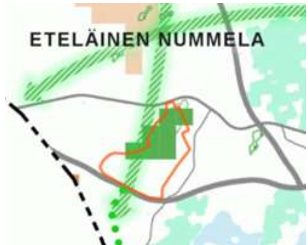
Suunnittelualan rajausta luonto- ja kulttuuriarvot-teemakartassa