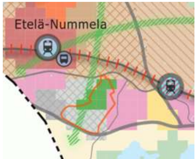
Suunnittelualan rajausta yhdyskuntarakenteen ohjaus-teemakartassa © Vihdin kunta