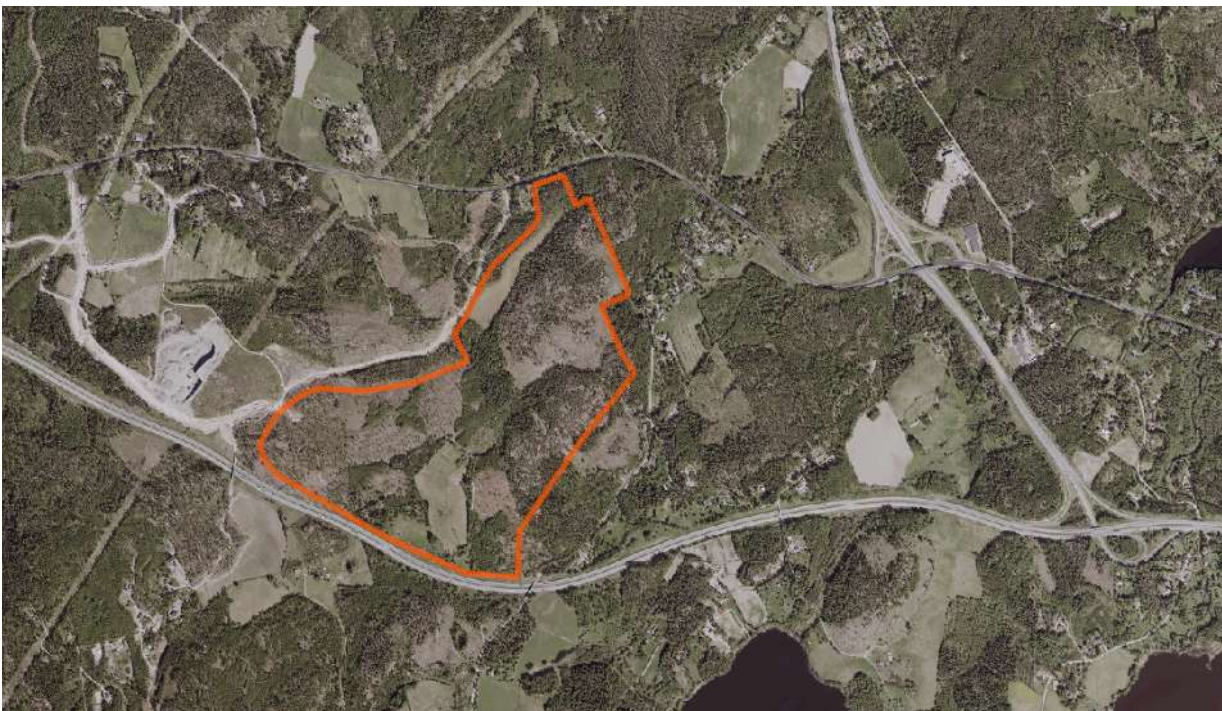
Kaava-alueen sijainti osoitettu punaisella rajauksella ortokartalla.

Kaavan tavoitteet tarkentuvat kaavatyön edetessä yhteistyössä osallisten kanssa.