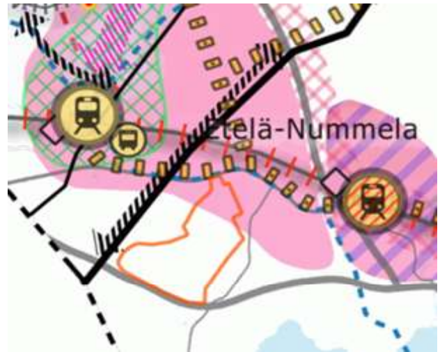
Suunnittelualueen rajausta kestävällä liikennellä ja yhdyskuntahuolto-teemakartassa © Vihdin kunta

Alue on kunnan omistuksessa, joten kaavaa ei koske sopimustarpeita.