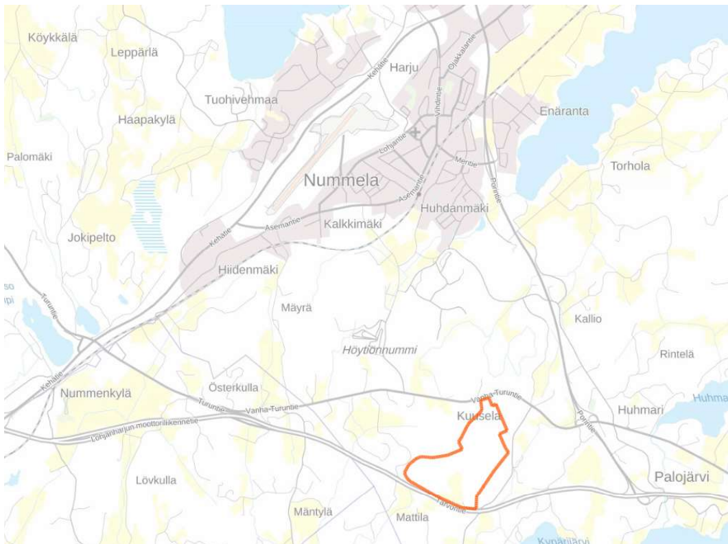
Kaava-alueen N202a sijainti osoitettu punasella rajauksella taustakartalle.

Kaavaa laadittaessa tulee riittävän aikaisessa vaiheessa laatia kaavan tarkoitukseen ja merkitykseen nähden tarpeellinen suunnitelma osallistumis- ja vuorovaikutusmenettelystä sekä kaavan vaikutusten arvioinnista.