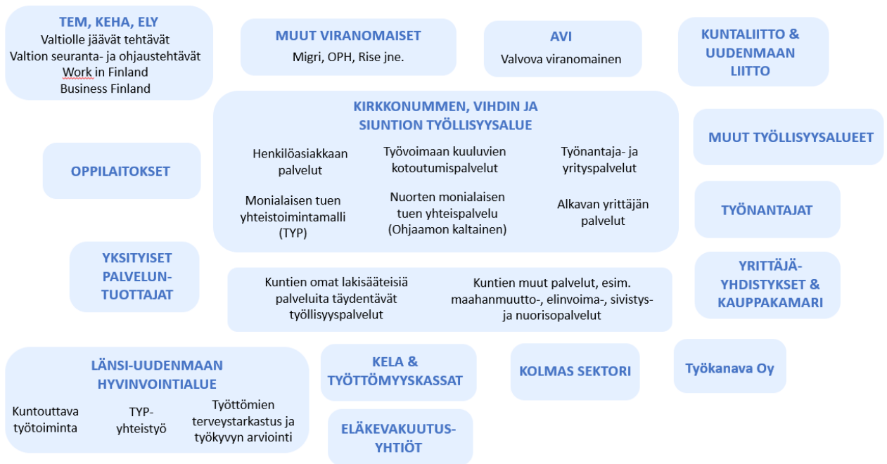
Kuva 4. Kuvaus tulevan työllisyysalueen mahdollisesta ekosysteemistä