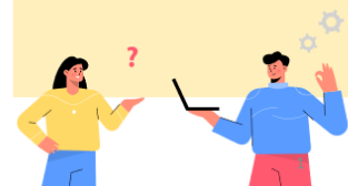
Kuva 2. Työvoimapalvelu-uudistuksessa siirtyvät tehtävät.