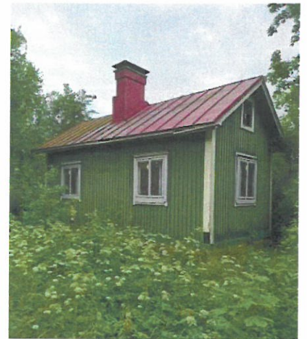
Vihreä Huvila takaa 2022