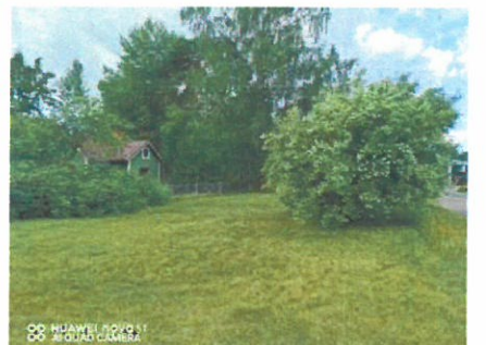
Jasmike puhkesi kukkaan 2022