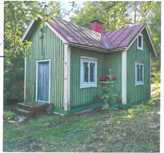
Nummelan keskustan vanhin asuintalo; Vihreä Huvila.

Vihdin Omakotiyhdistys ry on Suomen suurin Omakotiyhdistys, yli 4.100 jäsentaloutta, yli 13.000 henkilöä jäsenyyden piirissä