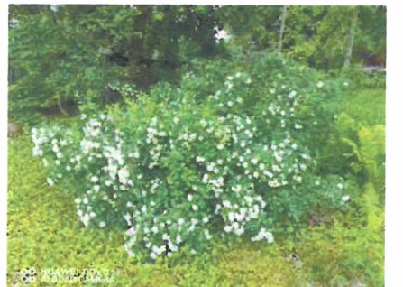
Juhannusruusut kukkivat 2022