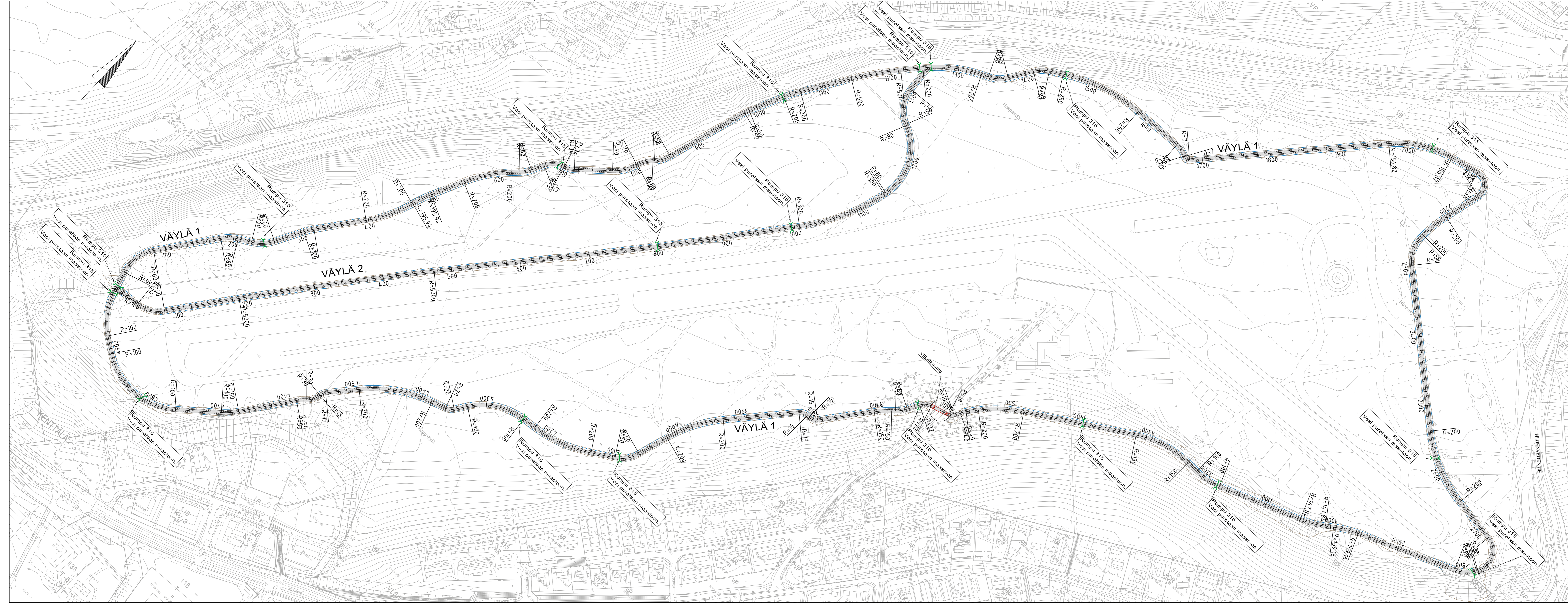
Tyypipölkkeikkaus 1:100 Kuntorata