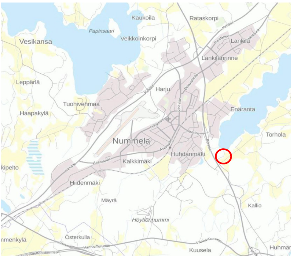
Kaava-alueen N203 sijainti osoitettu punasella ympyrällä taustakartalle.

Kaavaa laadittaessa tulee riittävän aikaisessa vaiheessa laatia kaavan tarkoitukseen ja merkitykseen nähden tarpeellinen suunnitelma osallistumis- ja vuorovaikutusmenettelystä sekä kaavan vaikutusten arvioinnista.