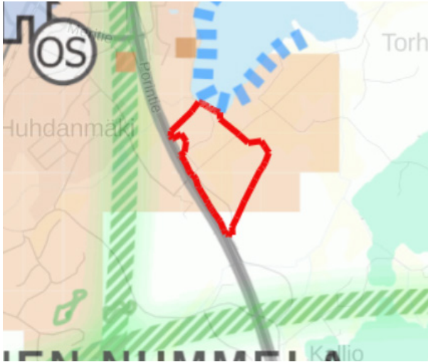
Suunnittelualueen rajaus luonto- ja kulttuuriarvot-teemakartassa