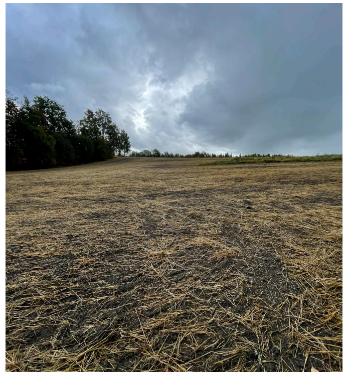
Kuvia suunnittelualueelta, syksy 2022