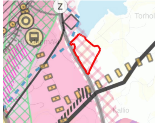
Suunnittelualueen rajaus kestävä liikenne ja yhdyskuntahuolto-teemakartassa