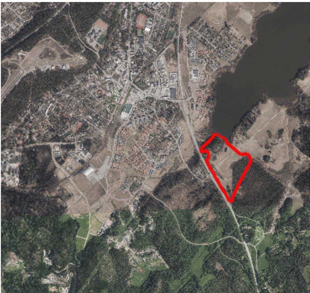
Kaava-alueen sijainti osoitettu punaisella rajauksella ortokartalla.

Suunnittelualue sijoittuu kokonaisuudessaan asemakaavoittamattomalle alueelle ja se on suurimmaksi osaksi rakentumaton aluetta. Suunnittelualue sijaitsee Porintien välittömässä läheisyydessä, jolloin alueen toteuttaminen vaatii melutorjunnan toteuttamista.