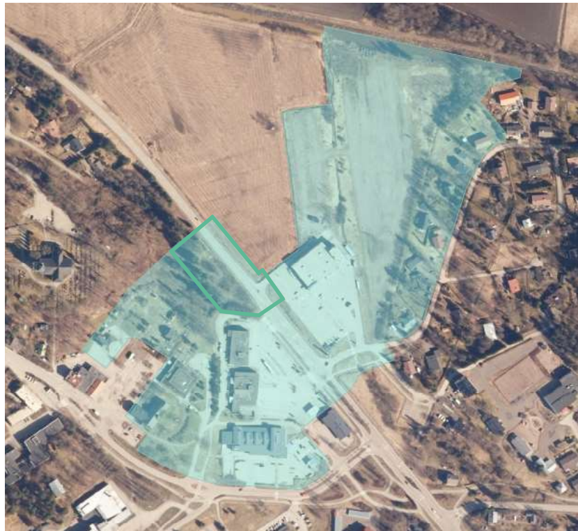
Kaava-alueen V47A likimääräinen rajaus on erotettu kaavan V47 koko aluerajauksesta.