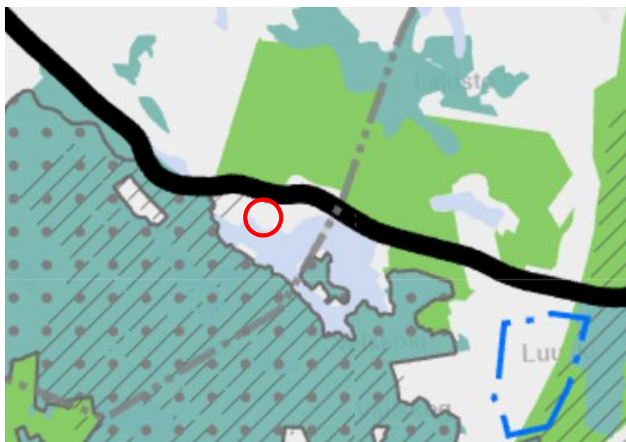
Kuva 2. Ote maakuntakaavojen epävirallisesta yhdistelmästä (Uudenmaan liiton tulkinta 11.11.2021). Suunnittelualueen likimääräinen sijainti on esitetty punaisella ympyrällä

Voimassa olevien maakuntakaavojen epävirallisessa yhdistelmässä suunnittelualueen läheisyydessä sijaitseva Nuuksio on merkitty Natura 2000 -verkostoon kuuluvana tai ehdotettuna alueena (pallorasteri, Uudenmaan maakuntakaava). Lisäksi Nuuksio on esitetty luonnonsuojelualueena (turkoosi alue, Uudenmaan 4. vaihemaakuntakaava). Lähimmillään suunnittelualueen länsipuolelle sijoittuu arvokas geologinen muodostuma (vinoviivitus, Helsingin seudun vaihemaakuntakaava). Lisäksi alueen pohjoispuolelle on merkitty virkistysalue Vaakkoi (vihreä alue, Helsingin seudun vaihemaakuntakaava).