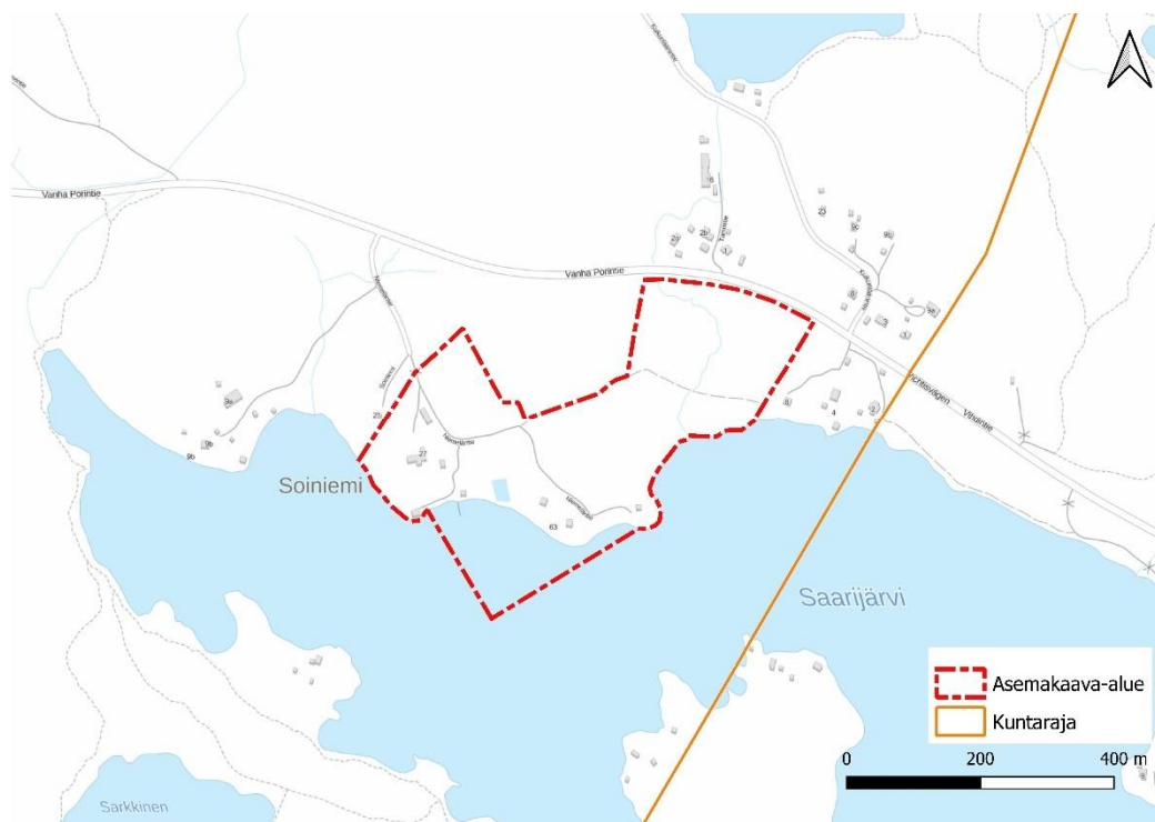
Kuva 1. Alustavan kaava-alueen sijainti (Maanmittauslaitos 2021).

Suunnittelualue sijoittuu Vihdin kunnan kaakkoisosaan Saarijärven pohjoisrannalle. Suunnittelualue on lähimmillään alle 200 metrin etäisyydellä Espoon kaupungin rajasta. Kuntaraja kulkee Saarijärven halki koillis-lounaissauntaisesti. Suunnittelualue käsittää kiinteistöt 927-430-2-4, 927-430-2-106 ja 927-430-2-108. Alue rajautuu koillisosasta maantiehen, etelässä vesialueeseen ja muilta osin vireisiin kiinteistöihin. Nuuksion kansallispuisto rajautuu Saarijärven lounaassa. Alueen pohjoispuolella kulkee Vanha Porintie (tie 120) ja alueelta on matkaa Otalammen taajamaan noin 11 km. Suunnittelualueen pinta-ala on noin 15,5 hehtaaria. Alue on kokonaan yksityisessä omistuksessa. Kaavan mitoitustarkasteluissa huomioidaan myös samaan kokonaisuuteen kuuluva, Vanhan Porintien pohjoispuolella sijaitseva, kiinteistö 927-430-2-45.